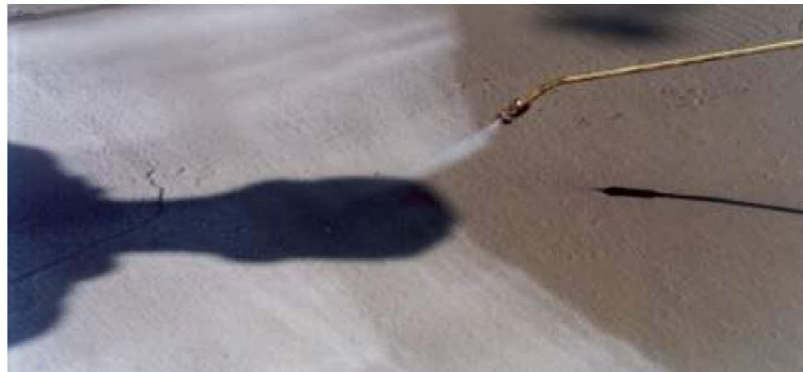
Betonun yerleştirilmesinden sonra şantiyede MasterKure uygulaması