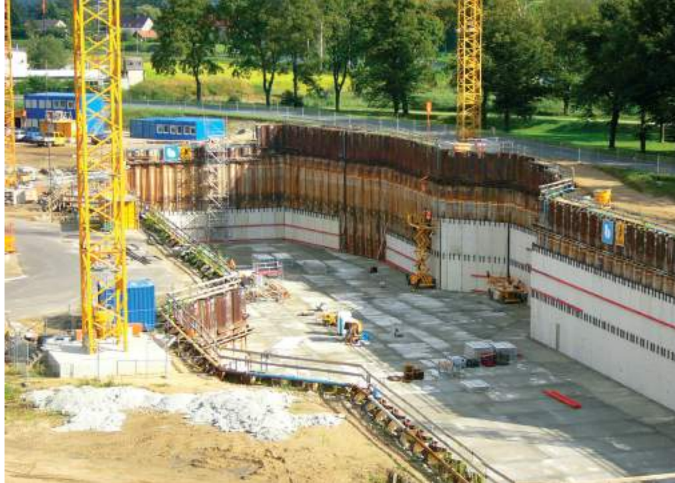
Niederfinow (Almanya) referansımız: Tekne asansörü