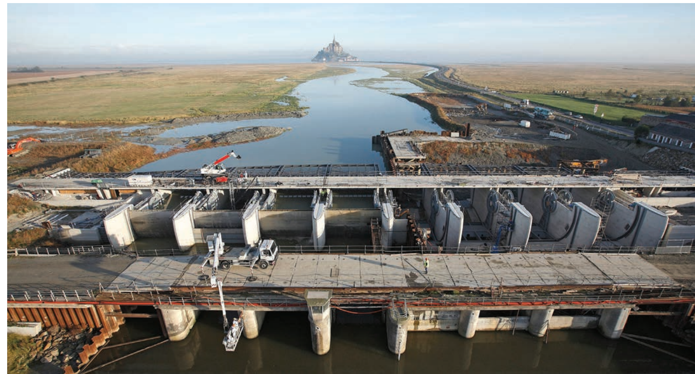
Mont Saint-Michel (Fransa) daki referanslarımız: Couesnon üzerindeki yükseltme havuzu