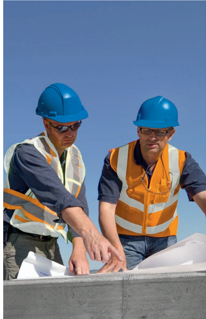
Kapak: Montpellier'deki (Fransa) referansımız: pierresvives - Hérault dept. - Zaha Hadid Architects

Ortaklık İnşa Etme. Master Builders Solutions uzmanlarımız size özel inşaat ihtiyaçlarını karşılamak için yenilikçi ve sürdürülebilir çözümler sağlamaktadır. Dünya çapındaki tecrübe ve ağımız, başarılı olmanız için bugün ve yarın size yardım etmektedir.