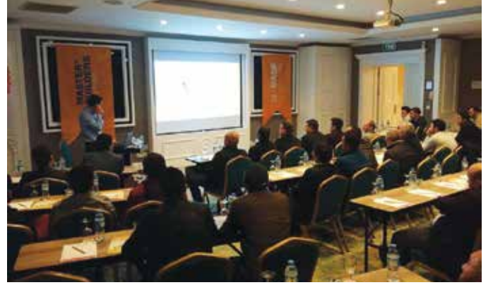
Çorlu Eğitimi, 71 Katılımcı - 19.02.2016

Eğitim seminerleriyle şu ana kadar 1164 katılımcıya ulaştık.