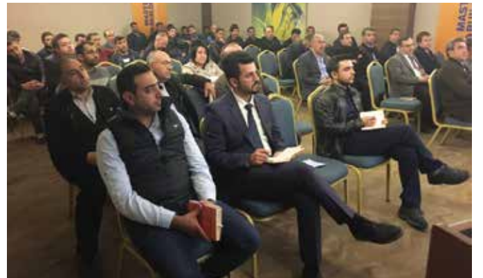
Elazığ Eğitimi, 55 Katılımcı - 30.03.2016