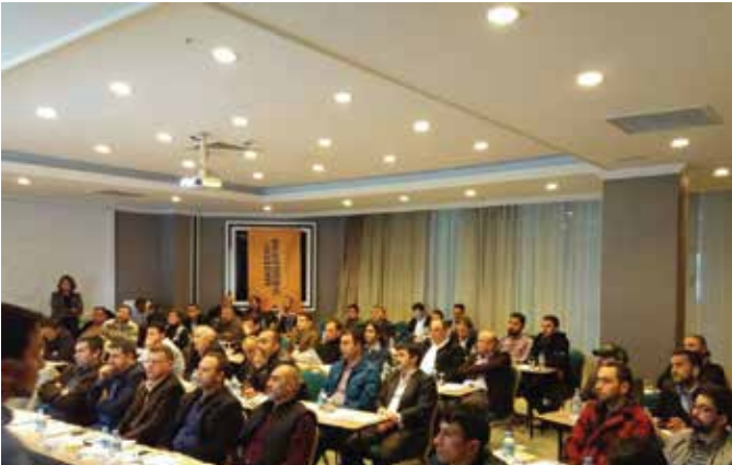
İstanbul Eğitimi, 57 Katılımcı - 17.02.2016

Eğitim seminerleriyle şu ana kadar 1164 katılımcıya ulaştık.