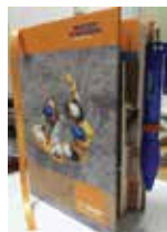
Fihrist Kesimli Usta Defteri