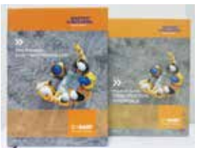
Türkçe Ürün Katalogumuz Çıktı!