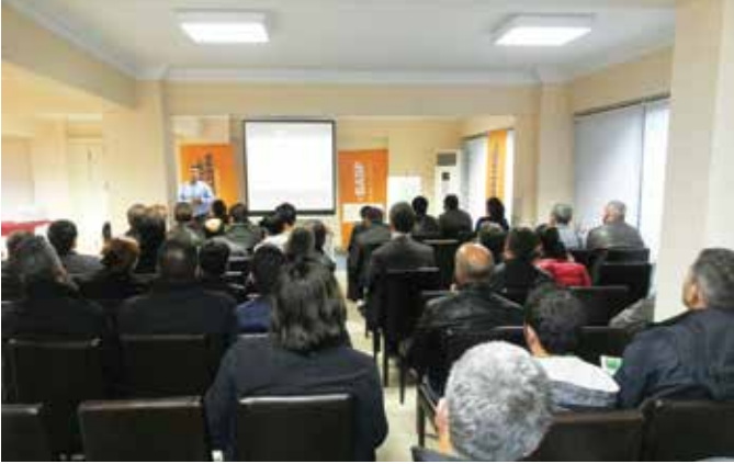
Bodrum Eğitimi, 54 Katılımcı - 18.12.2015

Usta eğitim seminerleri için İstanbul'dan Elazığ'a Türkiye'nin çeşitli illeri ziyaret edildi. Su yalıtımından, beton onarımına kadar ustalar ürünlerimiz hakkında bilgi sahibi oldu. İlgiyle karşılanan eğitim seminerleri hızla devam ediyor.