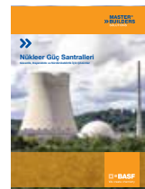
Nükleer Santral Broşürü