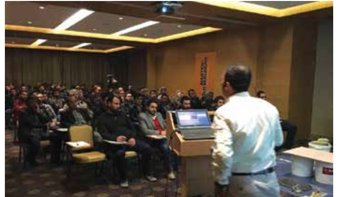
Malatya Eğitimi, 117 Katılımcı - 29.03.2016