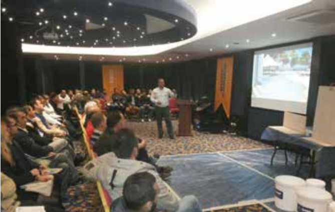
Fethiye Eğitimi, 110 Katılımcı - 13.01.2016