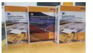
Teknik Şartnameler Bölümü Teknik Tanıtım Dosyaları