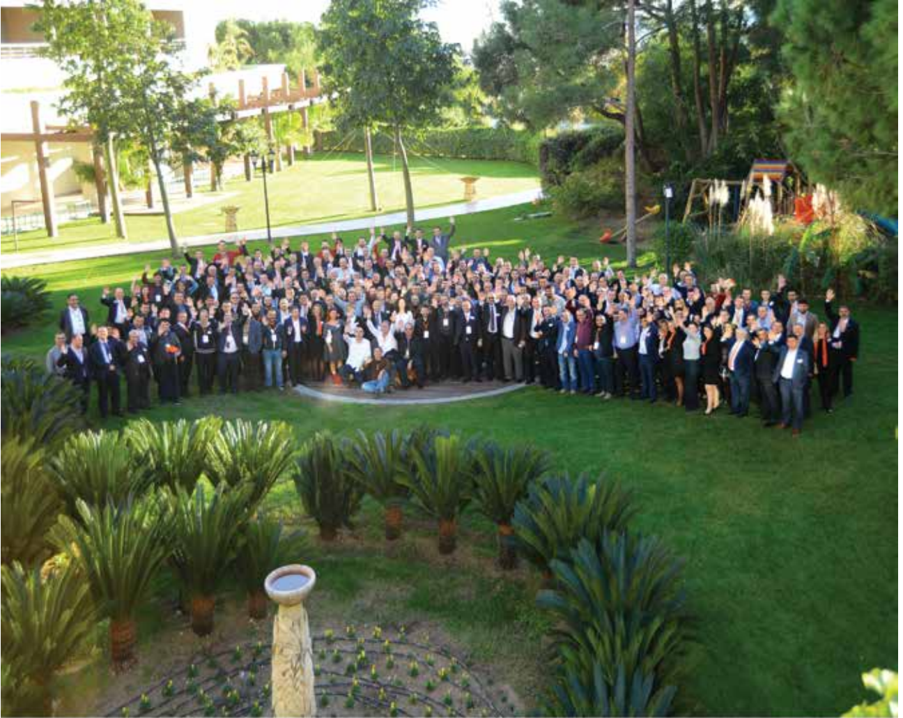
BASF Yapı Kimyasalları Bayi Toplantısı, Antalya Aralık 2015